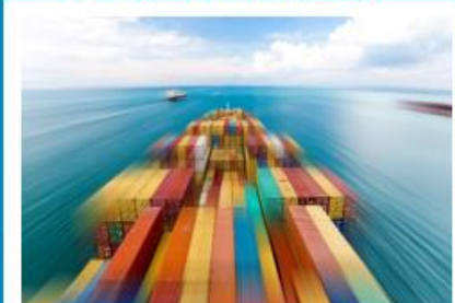
Forskning & innovation