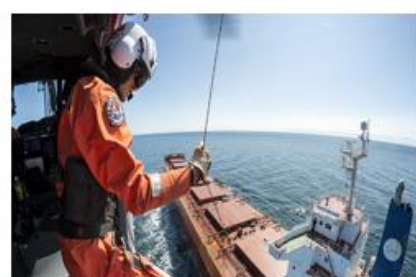
Sjö- och flygräddning